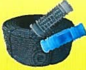
जैन टर्बोलाईन पी.सी.