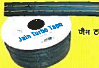
जैन टर्बो टेप