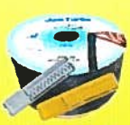
जैन टर्बो स्लिम